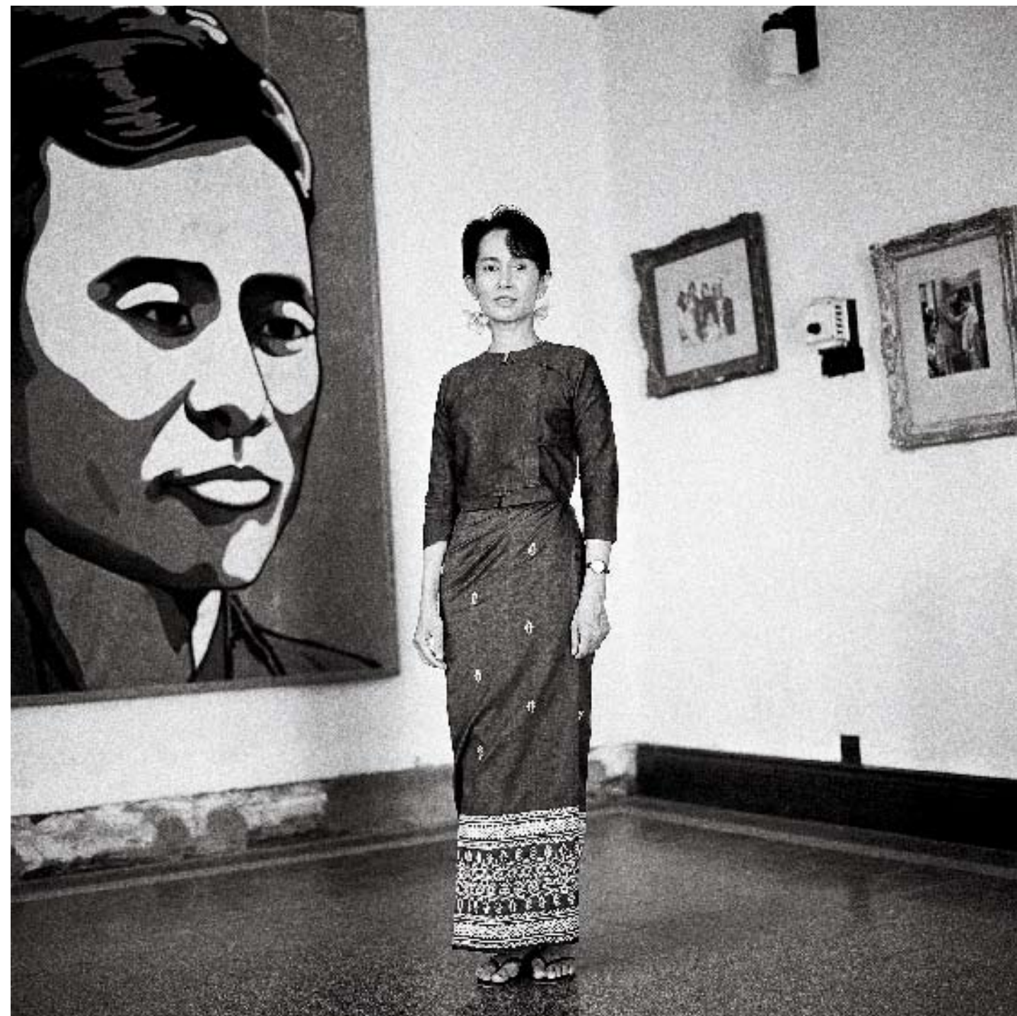
El ex presidente Jimmy Carter suele pasear en bicicleta por Plains, Georgia, donde vive. Lacombe lo fotografió en el 2002. Aung San Suu Kyi, premio Nobel de la Paz, en 1997, en su casa de Rangún, en Birmania, donde continúa arrestada. Orhan Pamuk, también en su domicilio, en Estambul, en el 2000